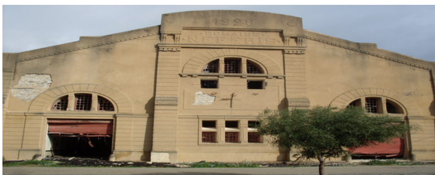
La cave du domaine Néférés à Khanguet el Hojjaj-Grombalia.