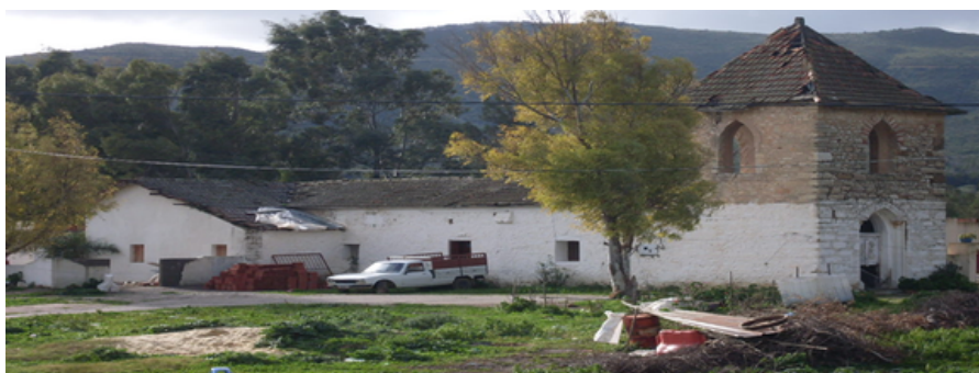
Une ferme de la période coloniale à Khanguet el Hojjaj-Grombalia.

Le domaine viticole de Khanguet el Hojjaj est formé de plusieurs édifices nécessaires pour la vinification. La cave de Khanguet el Hojjaj est de plan rectangulaire munie d'une toiture de tuiles rouges. Elle est construite avec soin, elle est bien aérée et protégée du soleil. Dans ce même sens Weyland dit que « la cave du Khanguet el Hojjaj représente l'une des plus anciennes caves de la région de Grombalia. Elle se situe dans l'ancien domaine Licari, le mur gouttereau de la cave s'adosse sur le terrain, le premier niveau renferme des portes, cela permet la facilité d'accès et des ouvertures sous forme de fenêtres pour l'aération de la cave. Le cellier, également primordial dans l'industrie du vin est composé de toute une vaisselle vinaire, foudres, pompes, réfrigérants, filtres... des cuves en bois ou en béton permettaient le stockage du jus de raisin pour sa fermentation spéciale afin que le vin puisse circuler d'un récipient à un autre. Parfois, dans certaines fermes, à côté du cellier on trouve un alambic pour la distillation des eaux de vie » [40].