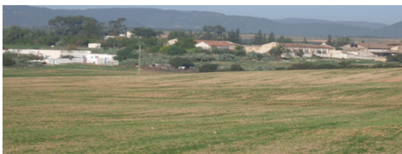
Une ferme de la période coloniale à Belli- Grombalia.

À Belli, Créte, Guyot, et de Fontane possédaient des oliviers, des huileries et des vignes.