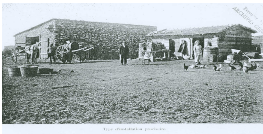
Type d'installation provisoire.

L'architecture viticole coloniale est une composante identifiant le paysage agricole de la plaine de Grombalia. En effet les colons agriculteurs ont construit dans ces espaces des bâtiments et des corps de fermes bien intégrés dans les paysages. Elles se distinguent de loin, sur le fond vert des forêts, grâce aux toitures inclinées, en tuiles rouges, de leurs caves et leurs murs blancs. Les timbres des tuiles rouges, en terre cuite, indiquent leur provenance et l'atelier de fabrication. Superposées en pente, elles résistent à la pluie et à la neige. La majorité des fermes contiennent des caves qui sont aussi les témoins de leur époque, elles présentent généralement une façade très bien architecturée où on trouve la gravure des noms des propriétés ainsi que la date de leur construction. Dans la plupart des régions de la plaine de bled Zira, des colons-propriétaires fermiers français ou italiens possédaient des domaines. Les fermes de bled Zira sont de différentes dimensions. Les petites