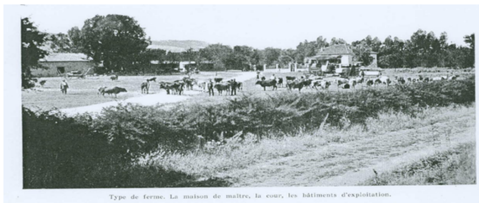
Type de ferme. La maison de maître, la cour, les bâtiments d'exploitation.