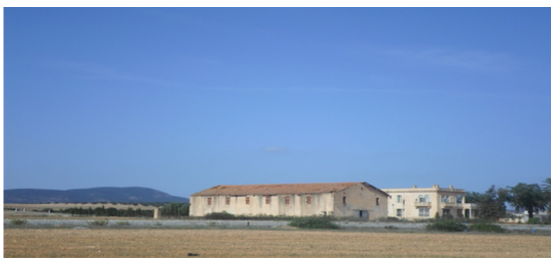
Une ferme de la période coloniale à Borj-Hfaedh, Bou Argoub.