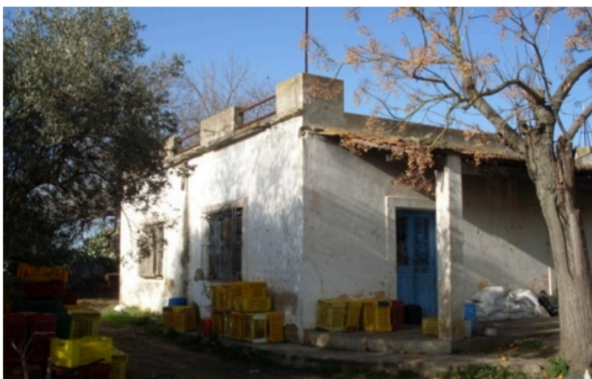
La ferme dite « El Habiba » à Bou Argoub b- Étude architecturale de deux exemples de caves